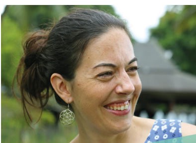
Autorin: Rosa Grabe Bereichsleitung Nachhaltige Beschaffung FEMNET e. V.

Die allermeisten Merchandise-Produkte können per Direktkauf oder unterschwellig beschafft werden. Dabei ist es bei Textilien die einfachste Lösung, sich an Gütezeichen/Siegeln zu orientieren. Werden drei Angebote gebraucht, so können diese für Produkte mit vergleichbaren Gütezeichen bei verschiedenen Anbieter*innen angefordert werden. So kann der Preis entscheiden, da ja bei allen die Mindeststandards erfüllt sind.