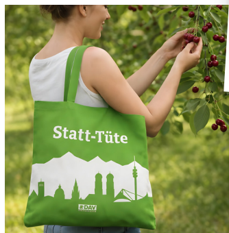
Baumwolltasche von Happy Brands

Individuell aromatisierte Teemischungen, u. a. mit einem Fairtrade-zertifizierten Darjeeling-Schwarztee bietet: → www.buhle-tee.de